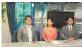
BS朝日 お昼のニュースアクセスで特集放映